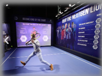
Interactive MultiBall wall - make any ballgame become interactive (illuminations.at)