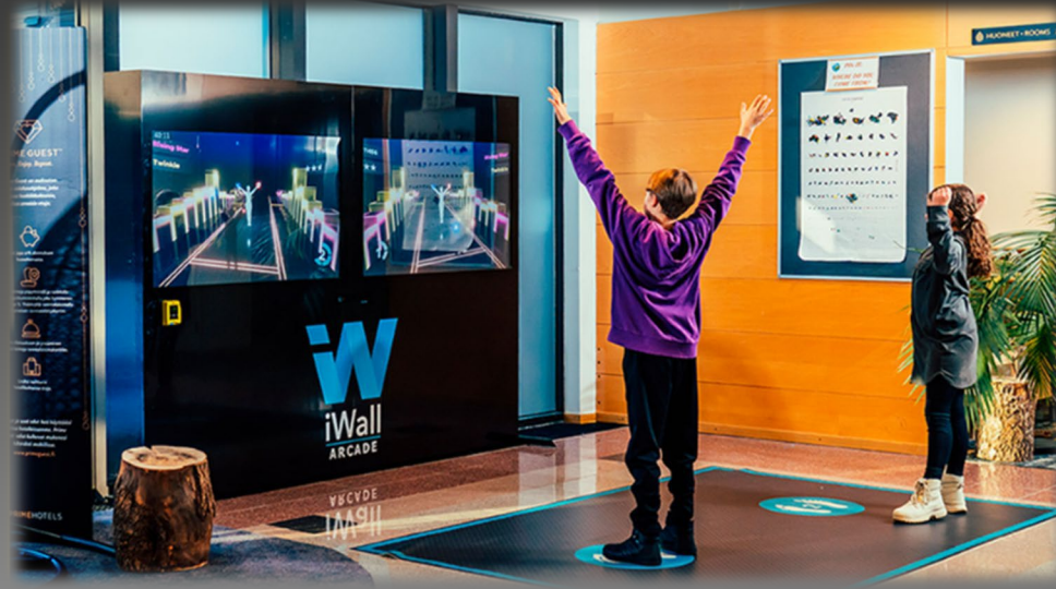
Nintendo Switch Sports - Launch Trailer - Nintendo Switch (youtube.com)