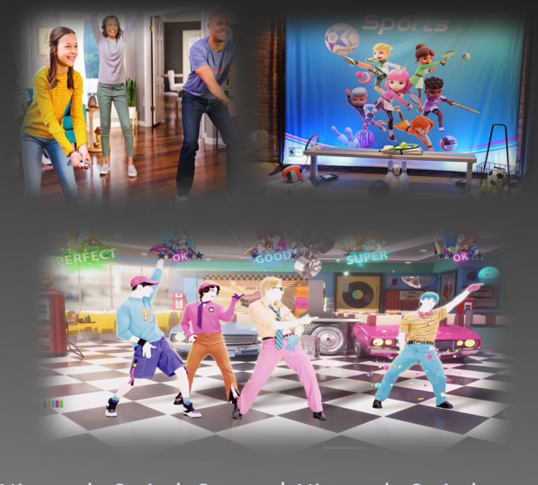
Nintendo Switch Sports | Nintendo Switch-Spiele | Spiele | Nintendo CH