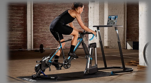
Shop Bike Trainers | Smart Bike Trainers | Wahoo Fitness EU